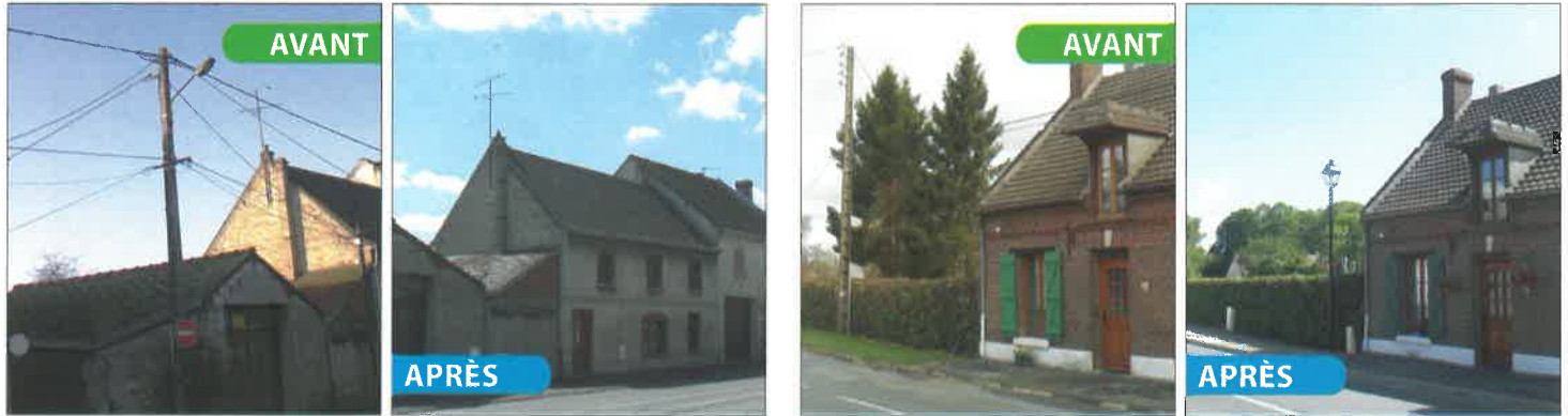
Exemple de travaux d'enfouissement des réseaux

Les travaux sur le réseau basse tension nécessitent l'intervention du SEZEO. N'hésitez pas à nous contacter pour tous vos projets. Le SEZEO dispose de marchés de maîtrise d'œuvre et de travaux qui évitent aux communes des procédures longues, coûteuses et complexes.