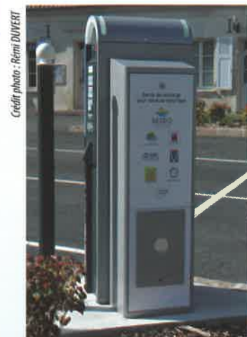
Borne de charge déployée à Clairoix

Les prochains rendez-vous du SEZEO seront l'occasion de vous tenir informés sur la mise en œuvre du déploiement.